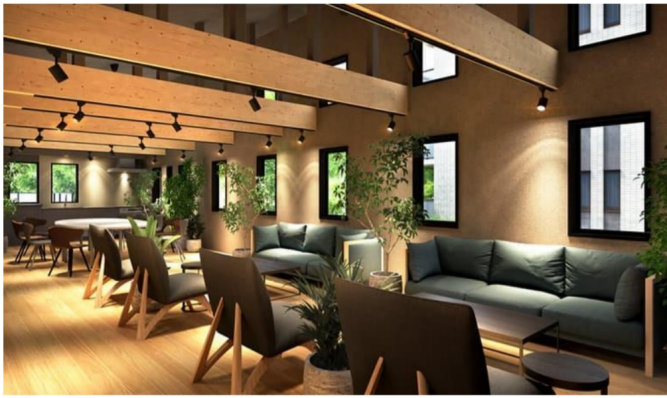
国産木材を使用した木造共用棟 飛鳥山レジデンス (完成予想パース)