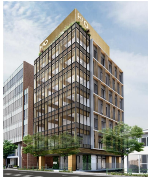
H'O外苑前 (完成予想パース)