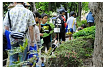
域の子供たちとの自然観察会

なお、当ビルは、生物多様性保全に配慮したオフィスビルとして、ABINC(一般社団法人いきもの共生事業推進協議会)の「いきもの共生事業所認証[都市・SC版]」を取得しています。