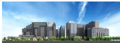
プラウドシティ日吉

本計画では、エリア全体でのエネルギーマネジメントにより、CO 2 排出量の削減および災害時の電力供給を可能にしています。