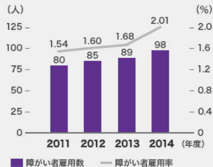
障がい者雇用数／障がい者雇用率

また、野村不動産パートナーズは、住まいるサポーター（マンション管理員）などとして、60歳以上の方を2,312名（2015年3月末現在）雇用しています。