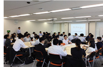
ダイバーシティ推進活動

その一環として、野村不動産では、2013年6月、社長を委員長にさまざまな部署・役職・性別の委員で構成される「ダイバーシティ推進委員会」を設置しました。ワークライフバランス、マネジメント力強化、中長期キャリア開発など、幅広い検討を行っており、3年計画で具体的な施策の提言・実行、浸透、定着に取り組んでいます。また、ダイバーシティへの理解促進を図るため、野村不動産は、専任担当の設置、専用ホームページの開設、ブログの配信など、社員とのコミュニケーションを強化しています。