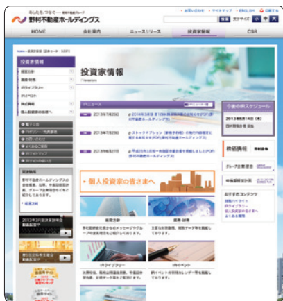
株主・投資家向けIRサイト

金融商品取引法などの関連法令および東京証券取引所の定める適時開示規則を遵守するだけでなく、Webサイトや決算説明会などを通じて積極的に情報を開示し、市場関係者とのコミュニケーションを推進しています。