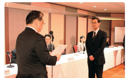
特殊暴力防止対策協議会より表彰

野村不動産ホールディングスは、2013年1月に新宿区特殊暴力防止対策協議会より表彰されました。同協議会は、企業に対する特殊暴力の排除を目的に1973年に結成された組織で、現在は新宿警察署管内の上場企業約90社が会員となっています。今回は、同協議会の各種役員・委員を務める等、組織運営に特に貢献したとして表彰されたものです。