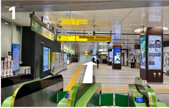
1 JR「浜松町駅」南口改札を出て、日の出栈橋／金杉橋方面へと直進します。