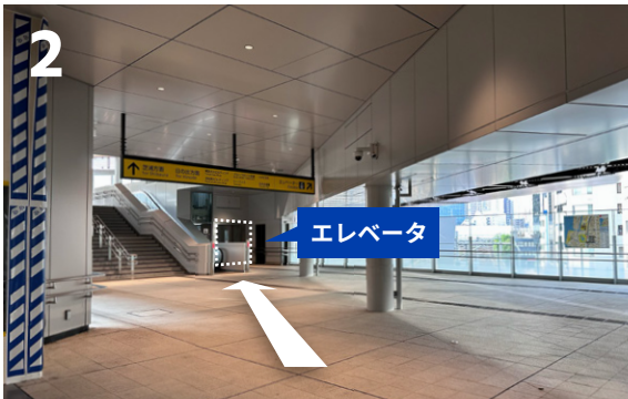
2 突き当りを左に曲がると、階段右側にエレベータがあります。