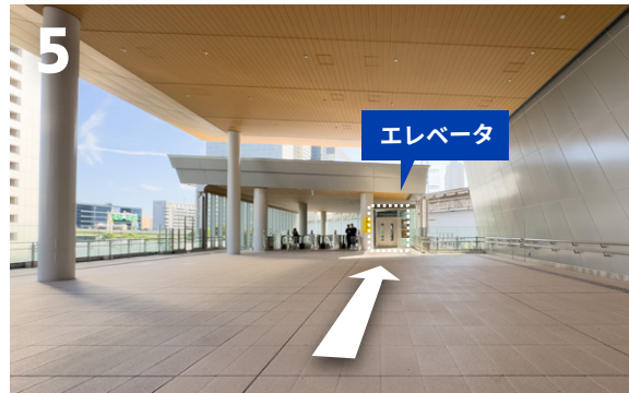
5 右奥のエレベータまで進みます。