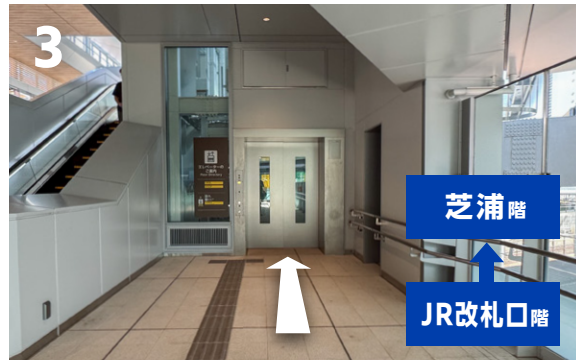
3 エレベータで芝浦階に上ります。(定員26名。降り口は乗り口と反対側です)