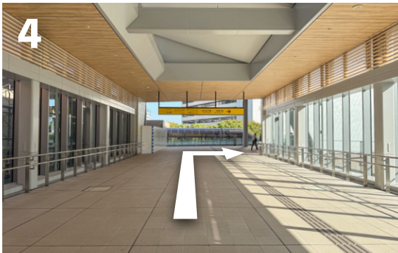
4 エレベータを出て直進し、ひとつ目の角を右に曲がります。