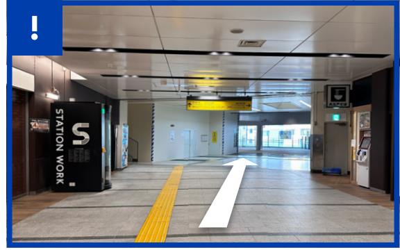
さらに芝浦方面へ直進すると、左手に工事中のエリアがあります。(2025年9月現在)