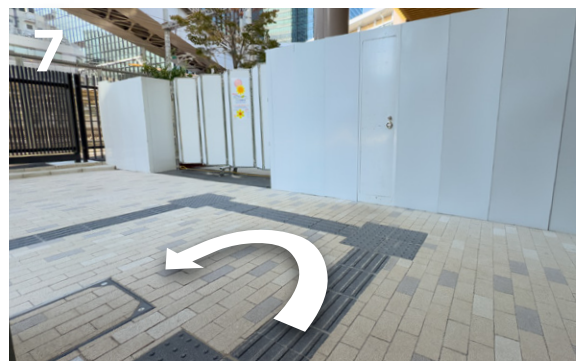
7 エレベータを出て、左側にUターンします。