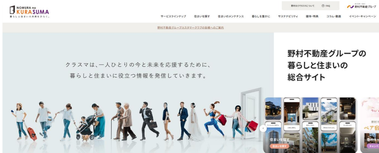
【リニューアル後の「野村のクラスマ」サイトのイメージ】

本リニューアルに際し、「野村不動産グループカスタマークラブ」の公式サイトと統合し、物件検討者から既取引者まで、幅広いニーズに対応できるサービスサイトとして生まれ変わります。これにより、更なるお客様の利便性向上を図り、お客様の生活に役立つサービスを提供してまいります。