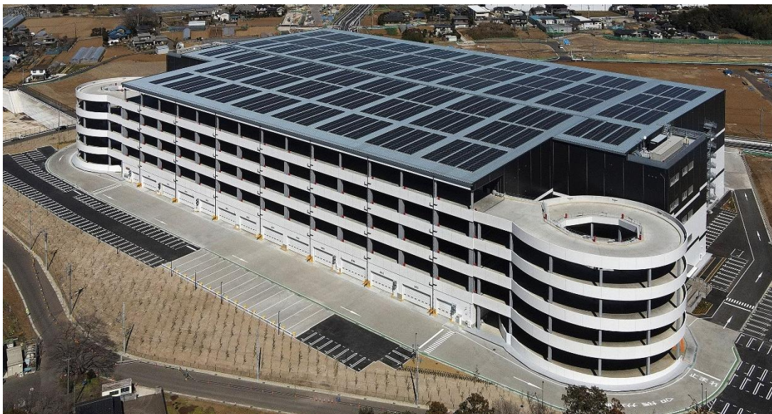
Landport 柏 I 外観

今後柏エリアでは、本物件隣接地の（仮称）Landport 柏 II、（仮称）Landport 野田 等複数の開発を予定しております。