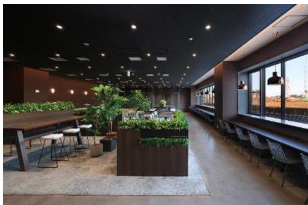
Landport 柏 I カフェテリア