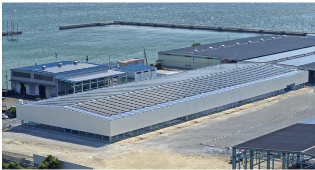
自社工場「Power Base」(岡山県玉野市)

また、自社工場「Power Base」においては、日本国内で最大級の生産能力を有する蓄電池モジュール製造ラインがまもなく稼働を開始する予定です。