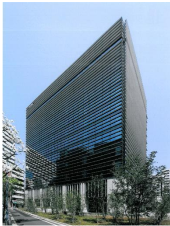
野村不動産芝大門ビル

※1 新たな再エネ発電設備を開発する事により、社会全体の再エネ増加に貢献すること