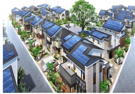
分譲戸建「プライドシーズン国立ガーデンシティ」完成予想図