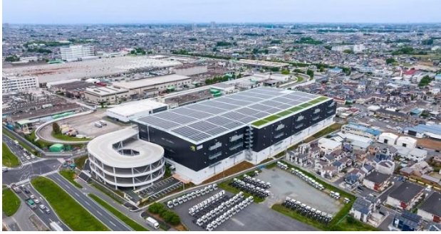
物流施設「Landport 上尾 II」