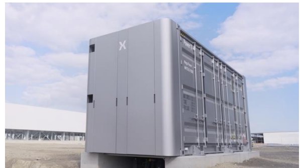
大型定置用蓄電池「Mega Power」