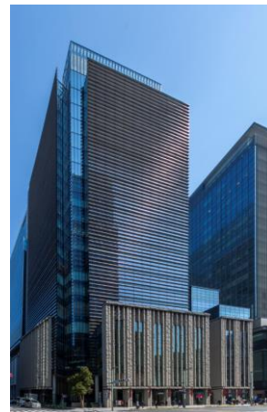
日本橋室町野村ビル

昨今の再エネを取り巻く環境として、事業活動で使用する電力を 100%再生可能エネルギー由来の電力で調達することを目標とする国際的イニシアチブ「RE100」の技術要件が 2022 年 10 月に改定されたことで、企業にとって追加性のある再エネの導入は、より社会的な要請が高まっています。一方で、自然要因に影響を受ける太陽光発電の需給調整や、市場の価格変動が予測困難である非化石証書の安定的な調達等、企業の再エネ活用には多くの課題が存在している状況です。