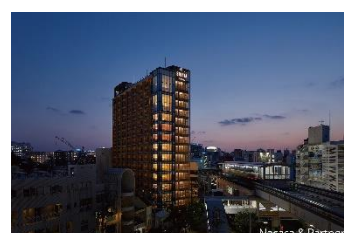
ホテル ストレータ 那覇