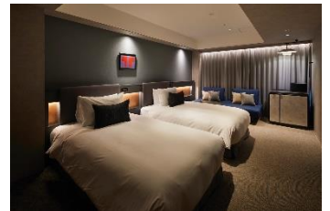
NOHGA HOTEL KIYOMIZU KYOTO