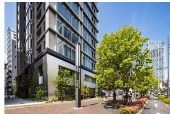
ブラウド新虎通り