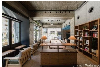
NODE GROWTH 湘南台