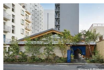
ONSEN RYOKAN 由縁 新宿