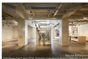
ホテル アンテルーム 京都