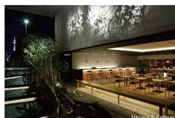
ホテル カンラ 京都