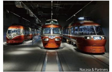
ロマンスカーミュージアム