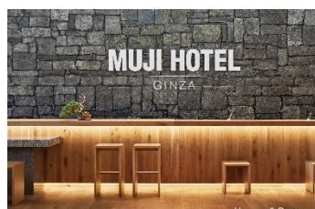
MUJI HOTEL GINZA