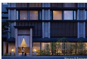
ONSEN RYOKAN 由縁 札幌