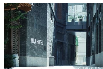
MUJI HOTEL BEIJING