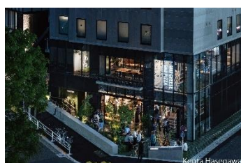
all day place shibuya