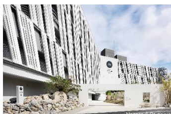
ホテル アンテルーム 那覇