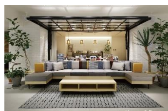
ホテル エディット 横浜