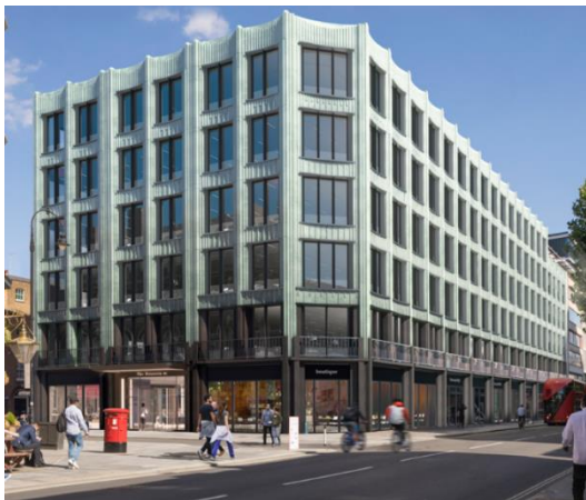
外観コンセプトパース