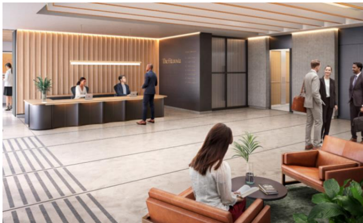
オフィスエントランスイメージ