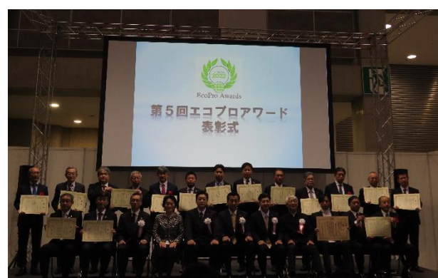
(受賞者での集合写真)