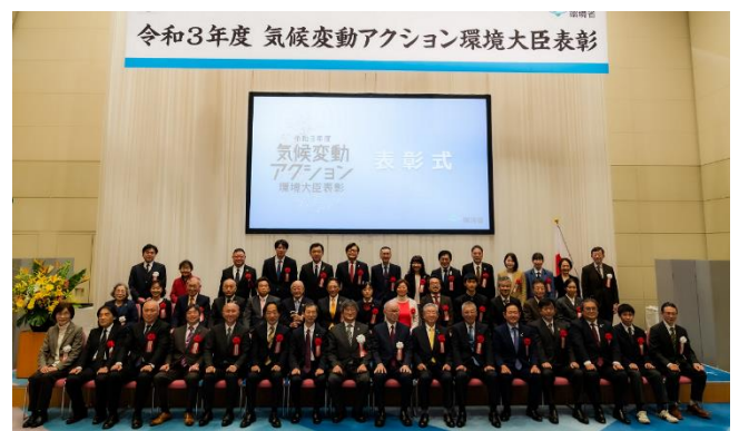
(受賞者での集合写真)