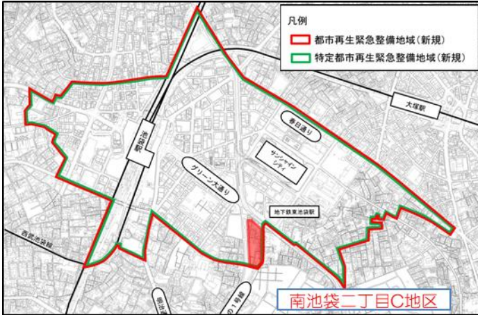
都市再生緊急地域・特定都市再生緊急整備地域

南池袋二丁目地区は、東京のしゃれた街並みづくり推進条例(東京都)に基づき、街並み再生地区に指定されております。池袋副都心に隣接した立地特性を活かし、サンシャインシティやしまエコミューズタウンなどと連携した東池袋駅周辺の拠点となるよう、高質な都心居住機能や子育て、高齢者向けの生活支援機能、豊島区役所等の防災拠点と連携した防災機能の導入を図り、賑わいのあるまちの形成を目指します。