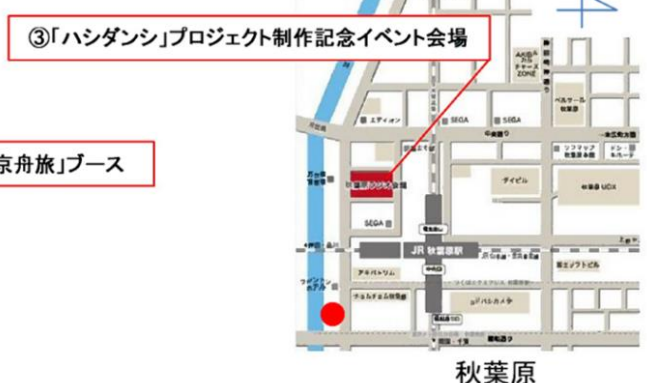
案内図 (ハシダンシカードの配布場所)