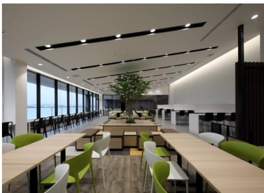
カフェテリア／「Landport 高槻」(竣工済)