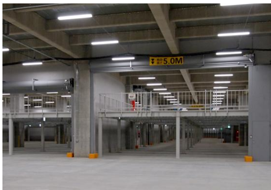
メザニン／「Landport 柏沼南 II」(竣工済)

テナント企業の従業員がランチタイムや休憩時に利用できる商業店舗やカフェテリア、シャワーブース（一部物件）などを設置し、快適な労働環境を提供します。