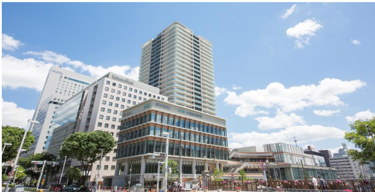
竣工写真：北西より区域全体を望む

10,000 m 2 超の敷地に住宅(プラウドタワー名古屋栄)・商業・オフィス等、多数の用途を取り入れた複合再開発(名称： Terrasse 納屋橋)となっております。堀川を見渡すように配した段状のテラスで各用途を結ぶことで、賑わいを演出し、既存環境との融合を目指した再開発事業となっております。