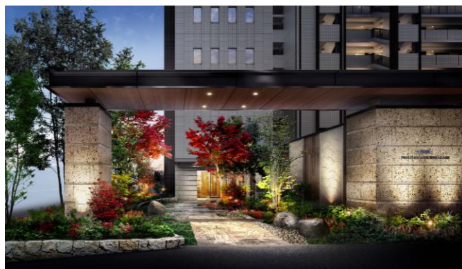
「プライド東白壁」 外観完成イメージ

https://www.proud-web.jp/nagoya/p-higashishirakabe/