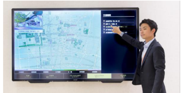
「大型タッチパネル」