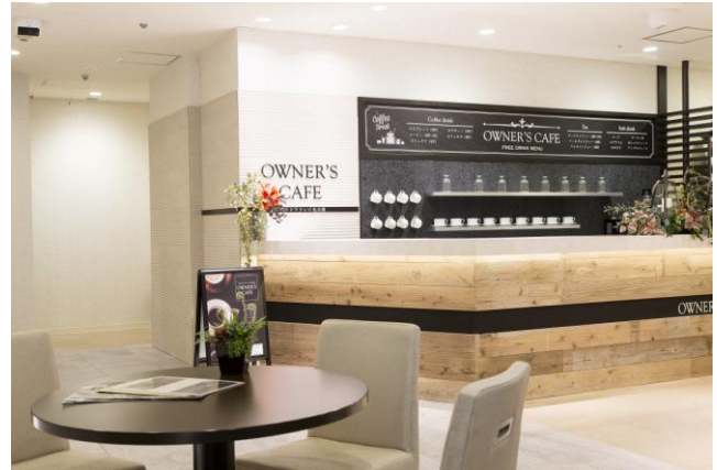
施設内の無料カフェスペース「オーナーズカフェ」