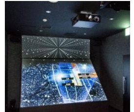
「プロジェクションマッピングシステム」