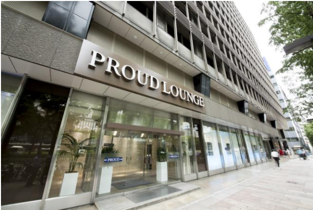
「プロウドラウンジ名古屋」外観

案内開始物件としては、名古屋都心プロジェクト第 1 弾として、「プロウド東白壁」「プロウドタワー名古屋伏見」の 2 物件を予約制にてご案内を開始する予定となります。他 4 物件については、随時ご案内を開始致します。